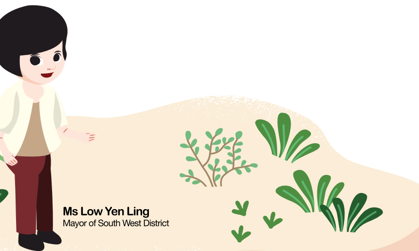
Ms Low Yen Ling Mayor of South West District

感谢你们无私的奉献和承诺，致力打造一个永续和绿色的环境，坚韧，积极以及居民互助和互相信任的西南社区。